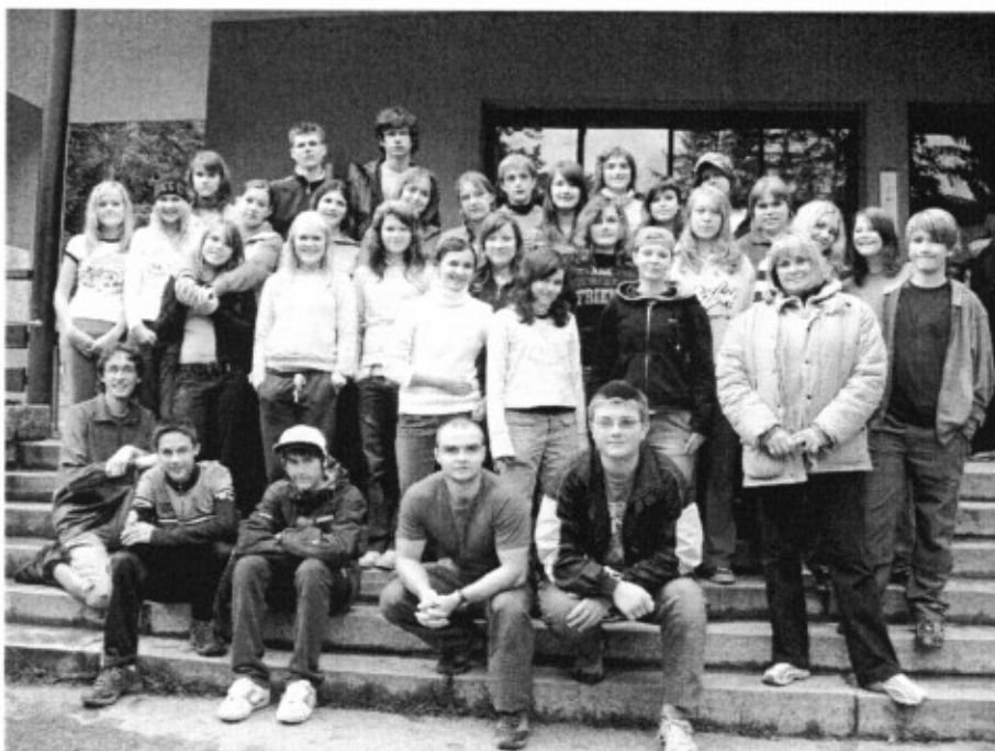
Třída 1. B Harmonizační dny si užila a líbily se jim.