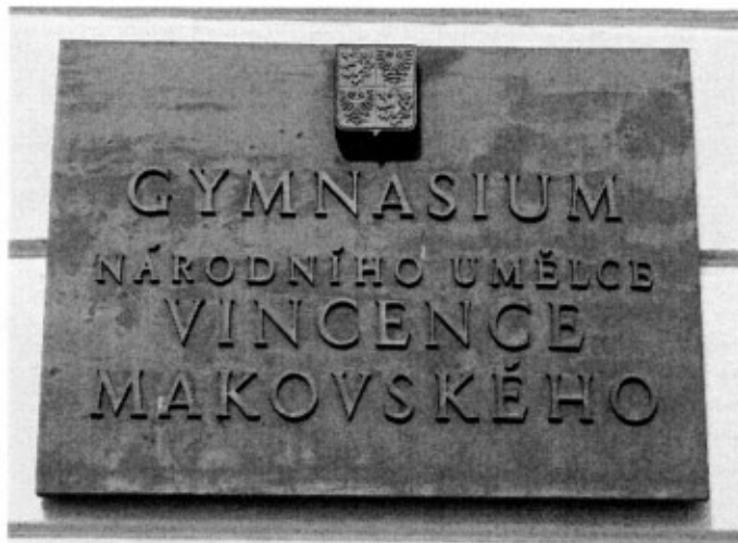
Deska Vincence Makovského u vchodu do školy