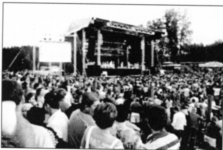
Lx Foto - Zuzana Petřů