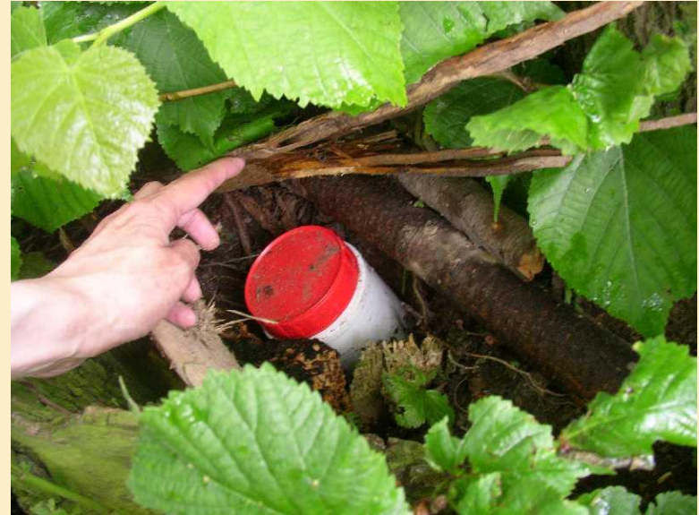
Obr. 2: Ukázka schránky s pokladem (geocache)