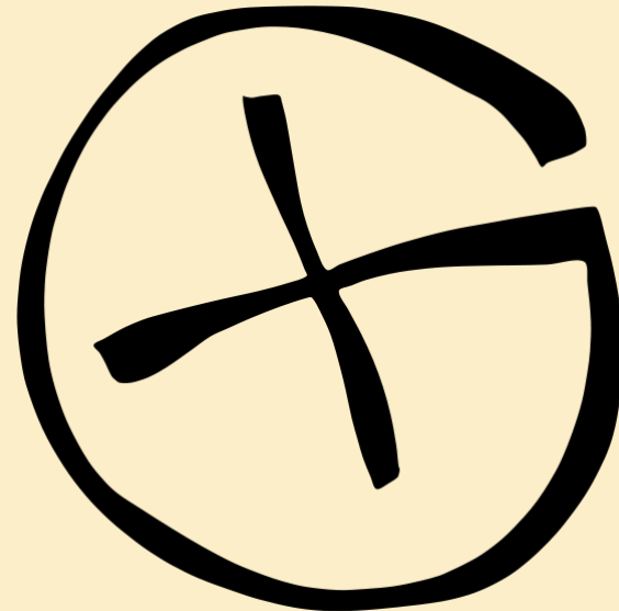
Obr. 1: Mezinárodně používaný symbol pro geocaching