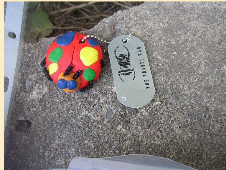
Obr. 9: TravelBug