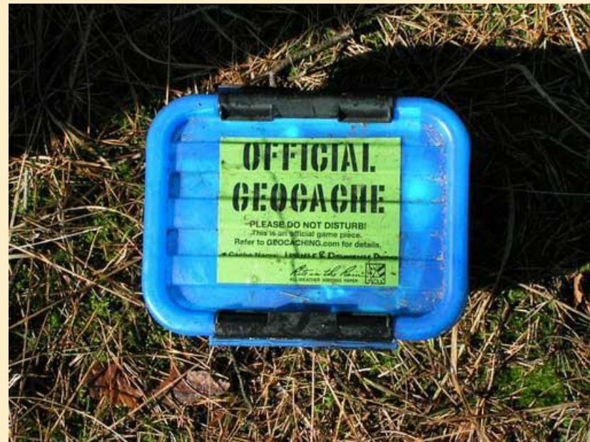
Obr. 3: Nejčastějším typem schránky jsou krabičky na potraviny