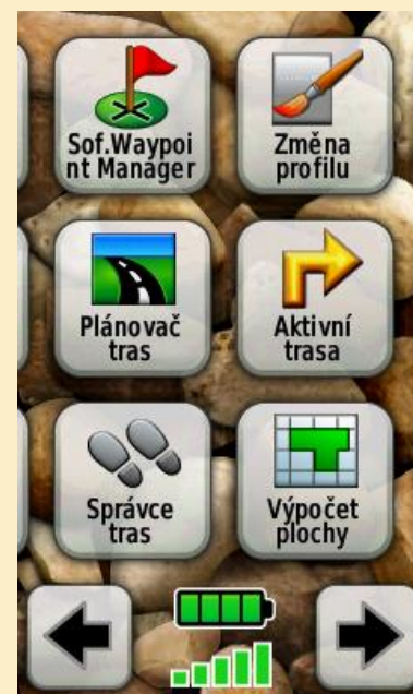
Obr. 9: Hlavní menu s nabídkou Správce tras