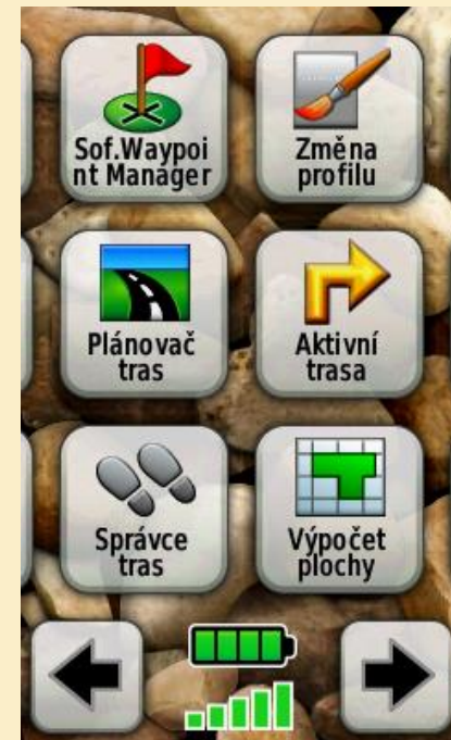
Obr. 8: Hlavní menu s nabídkou Plánovač tras