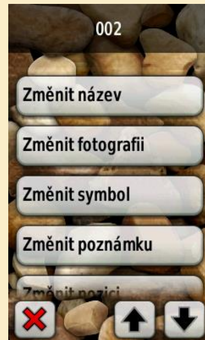
Obr. 2: Parametry trasového bodu