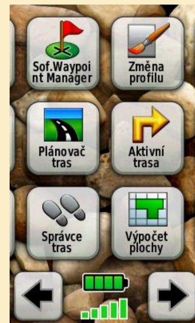
Obr. 3: Hlavní menu s nabídkou Waypoint Manager