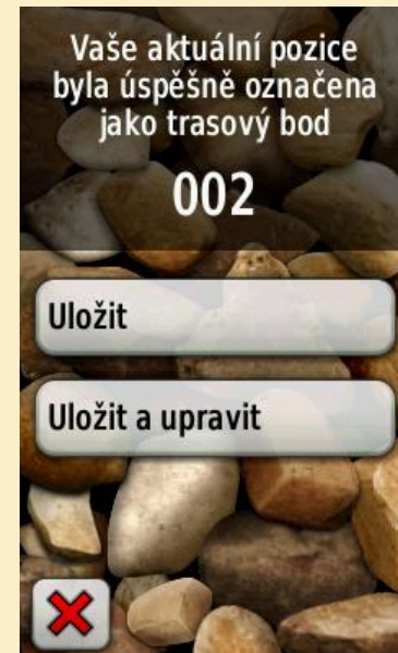
Obr. 1: Uložení trasového bodu