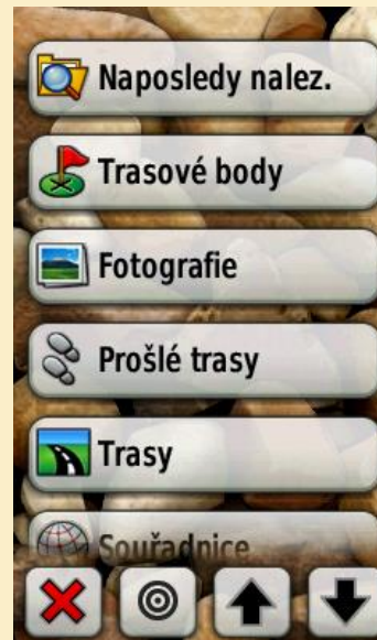
Obr. 5: Způsob vyhledání cílového bodu