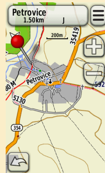
Obr. 7: Navigace k bodu na mapě