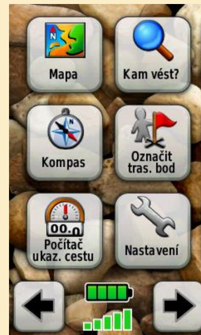
Obr. 4: Hlavní menu s nabídkou Kam vést?