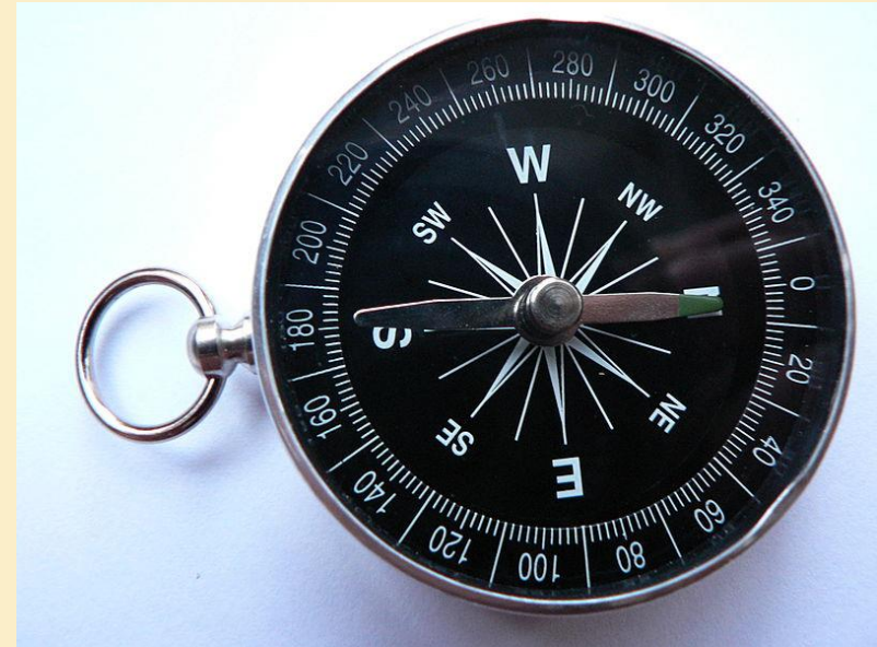
Obr. 1: Kompas