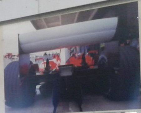
Ferrari F3003 Squadra 2003

osama FOX SERRA BENSON & HEDGES CdeZ CARRER