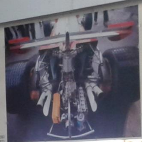
Ferrari F3003 Motore 1999

Vertical text on a display panel, possibly a list of names or dates, including the word "STAZIONE" at the top.