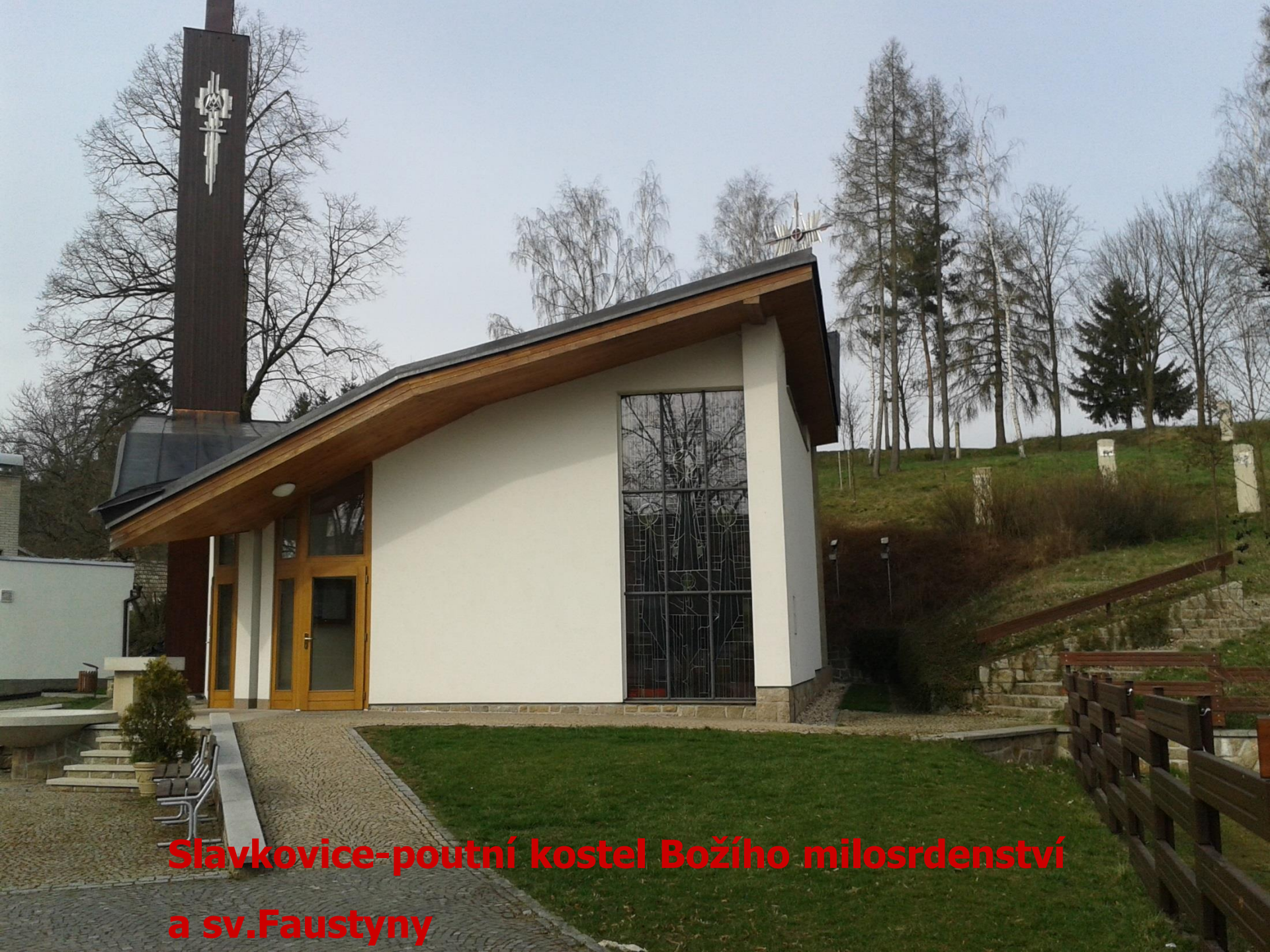
Slavkovice-poutní kostel Božího milosrdenství a sv.Faustyny