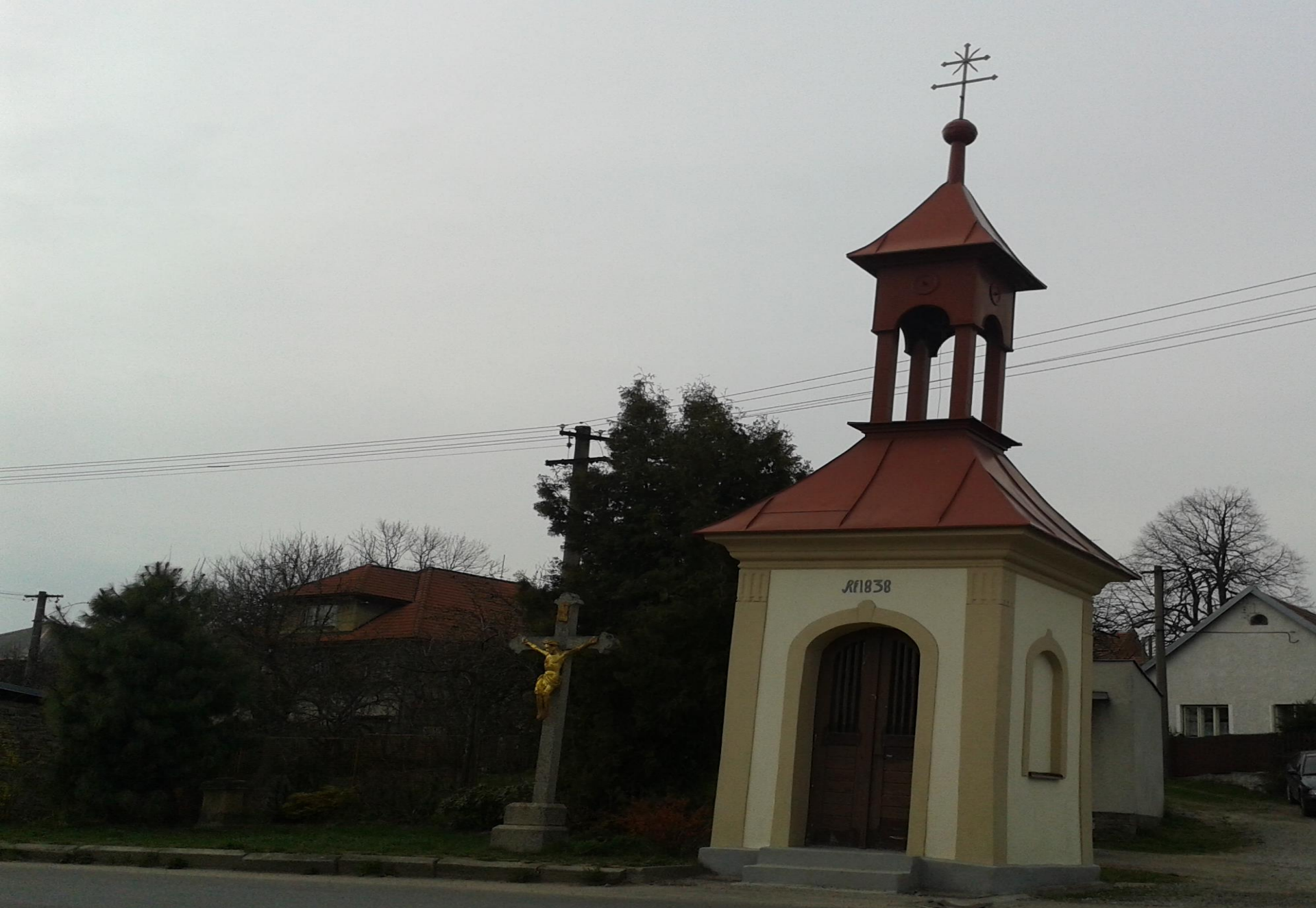
Kaplička v Pohledci