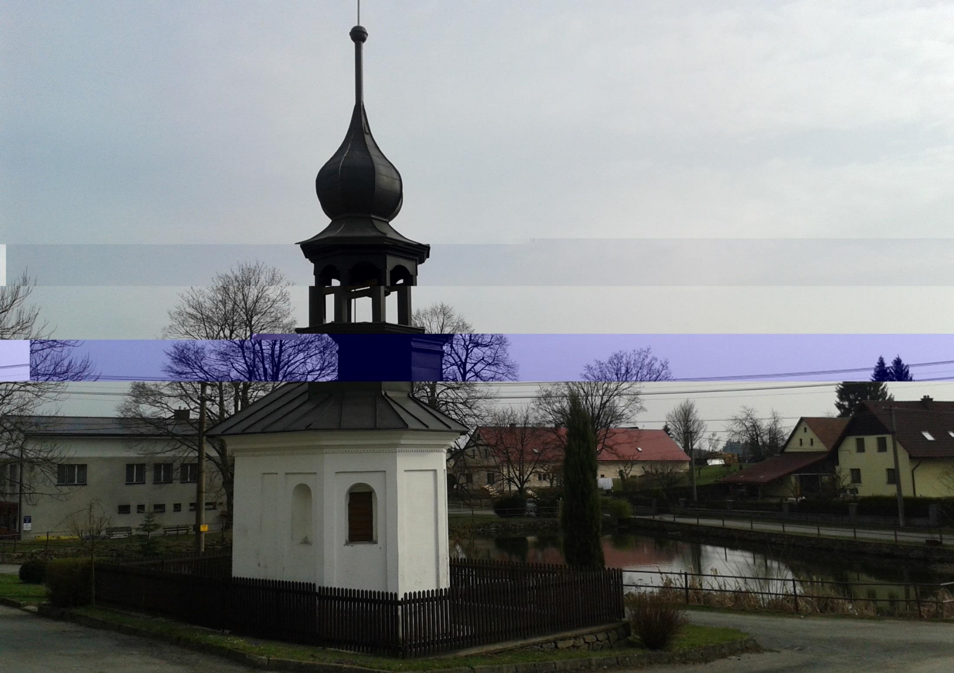
Kaplička v Petrovicích