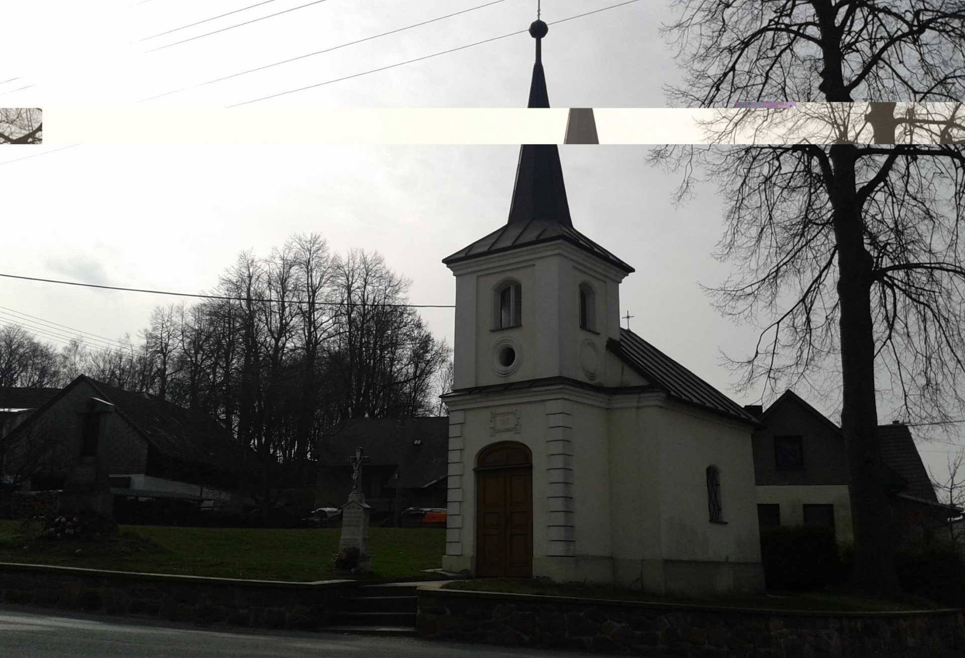
Kaplička v Hlinném