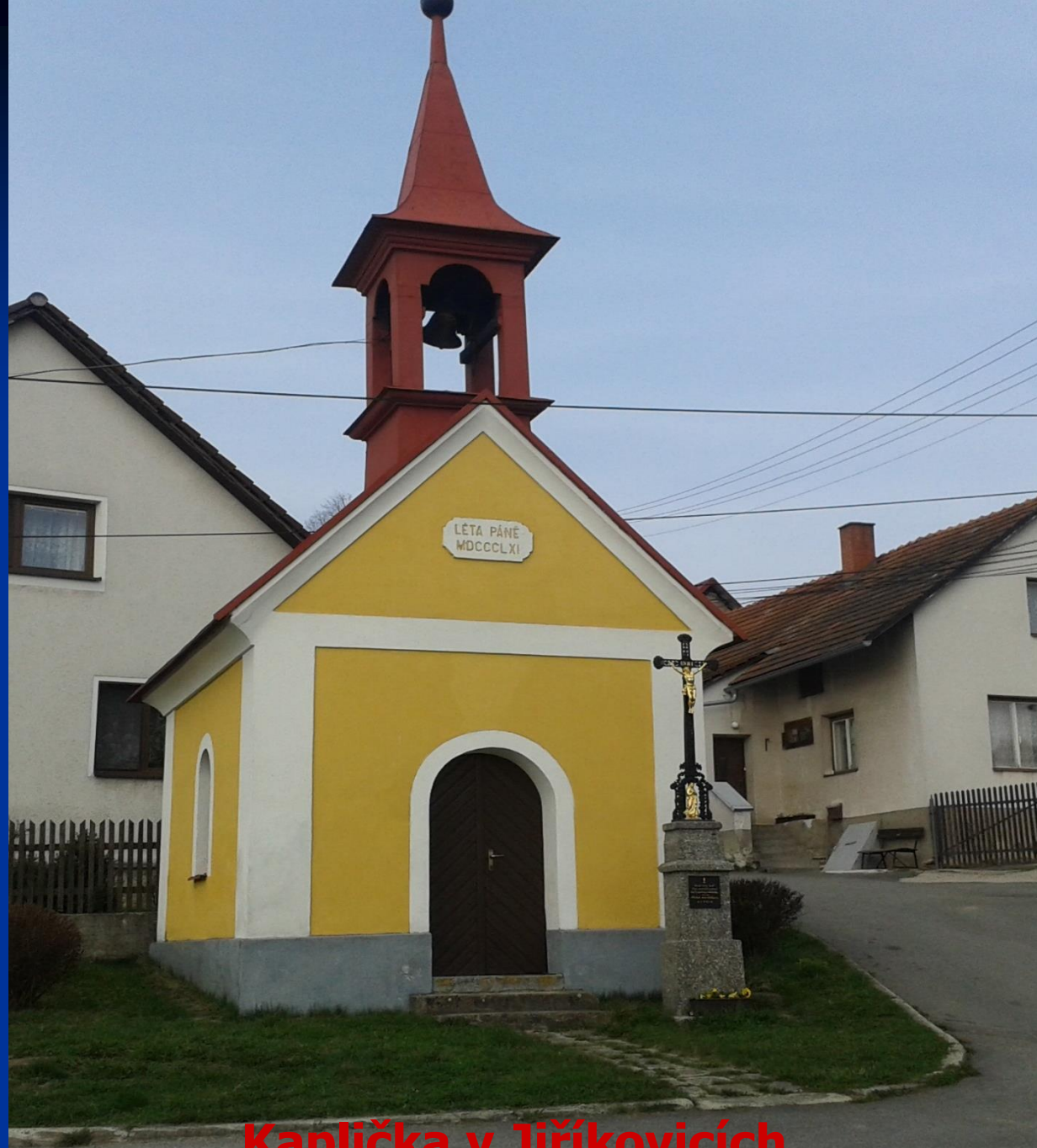
Kaplička v Jiříkovicích