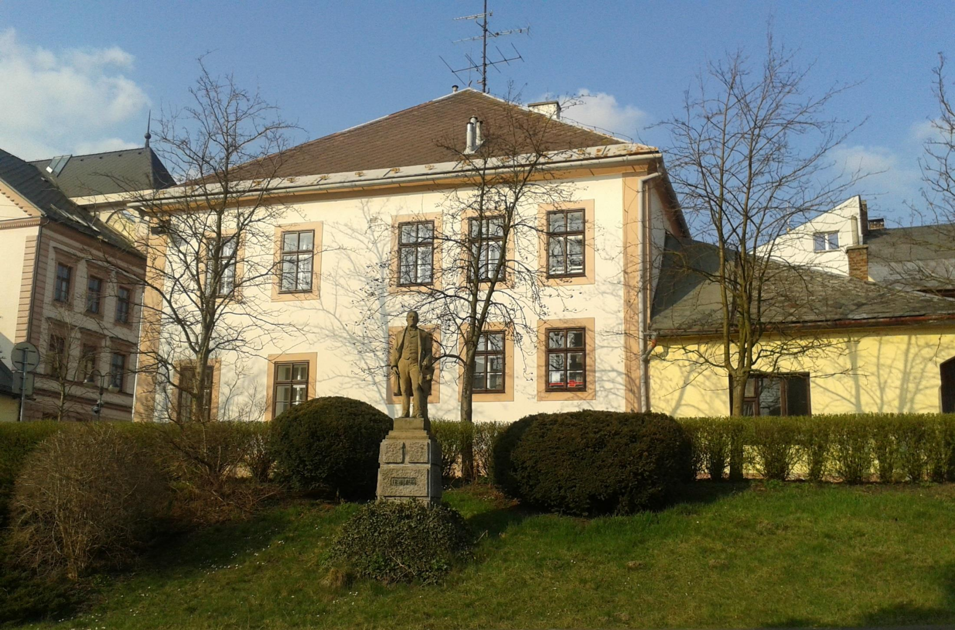
Socha Fr. Palackého na Palackého náměstí