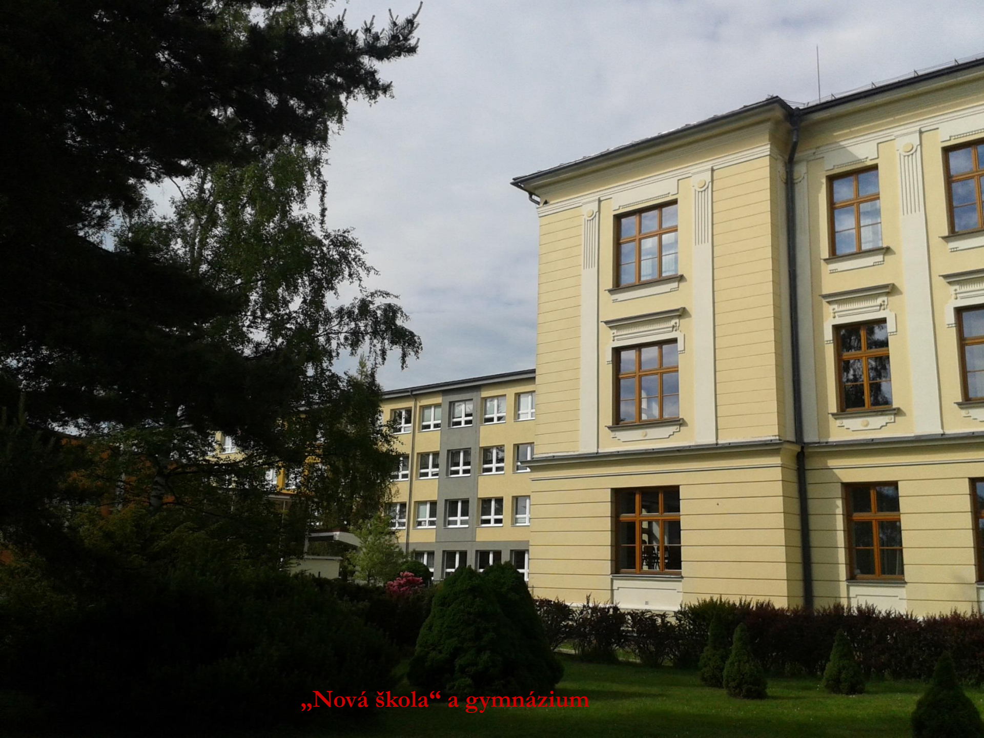
„Nová škola“ a gymnázium