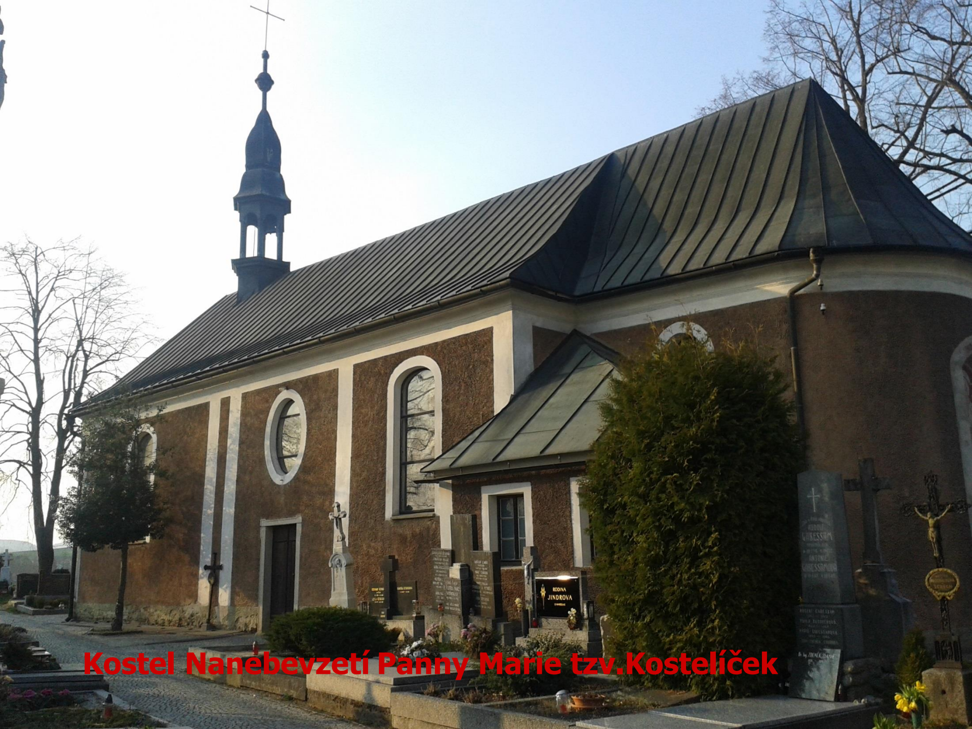
Kostel Nanebevzetí Panny Marie tzv.Kostelíček