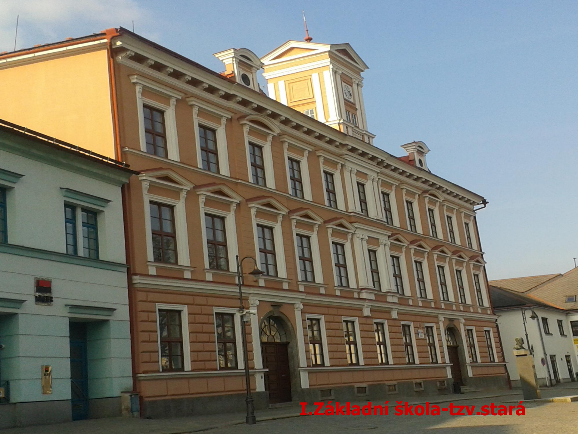
I. Základní škola-tzv. stará