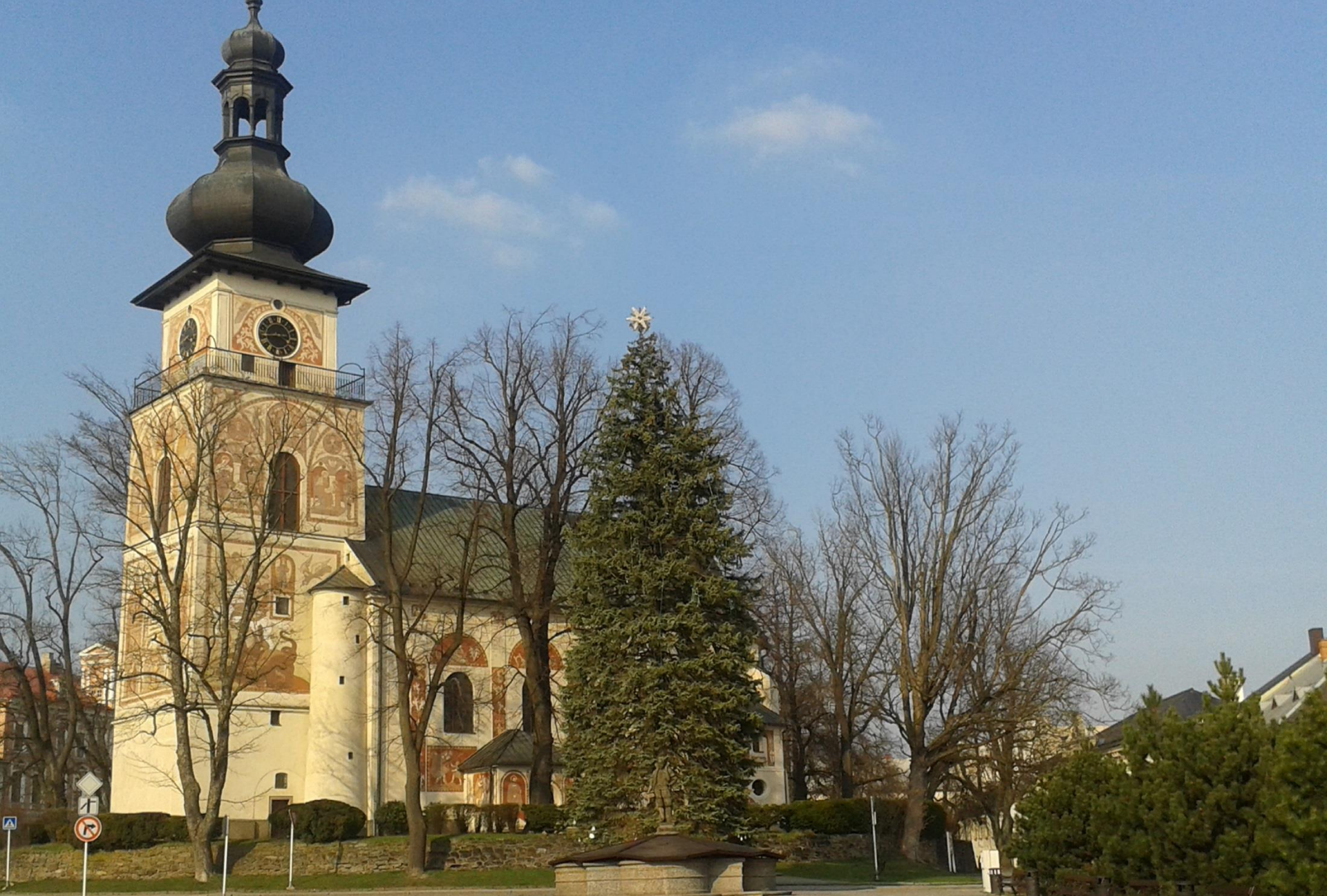
Katolický kostel sv.Kunhuty na Vratislavově náměstí