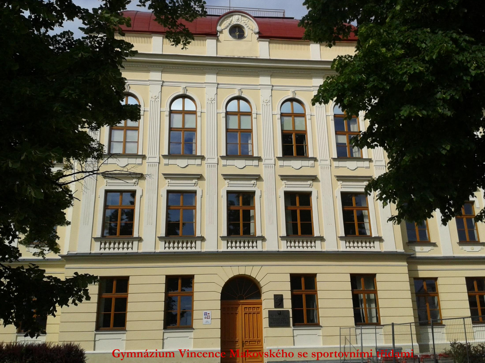
Gymnázium Vincence Makovského se sportovními třídami