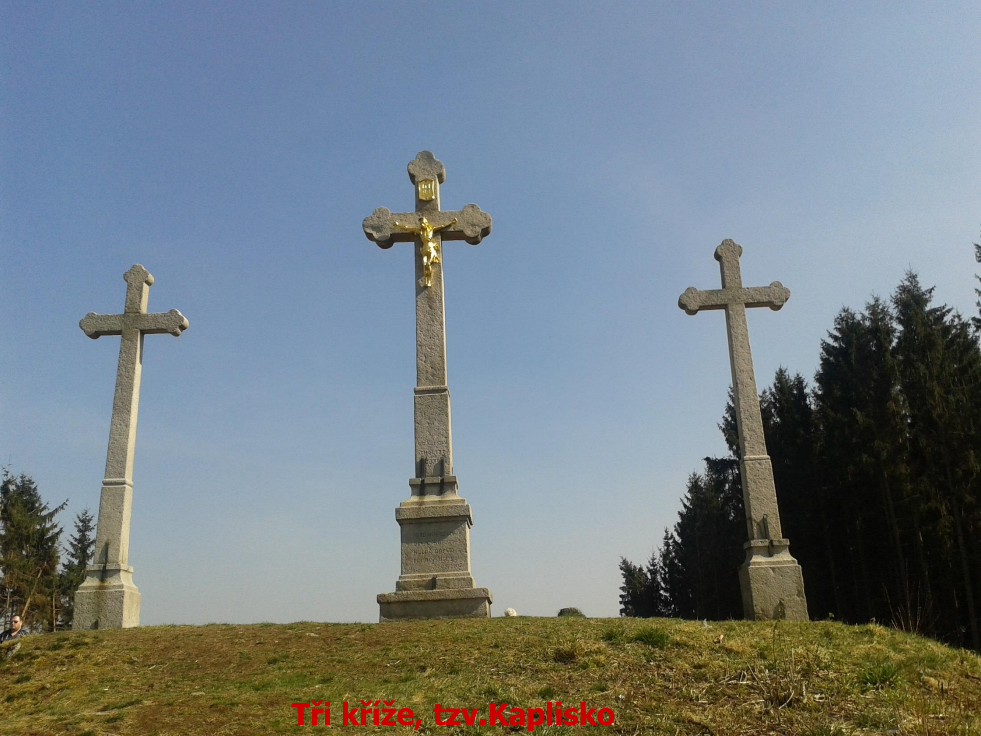
Tři kříže, tzv. Kaplisko