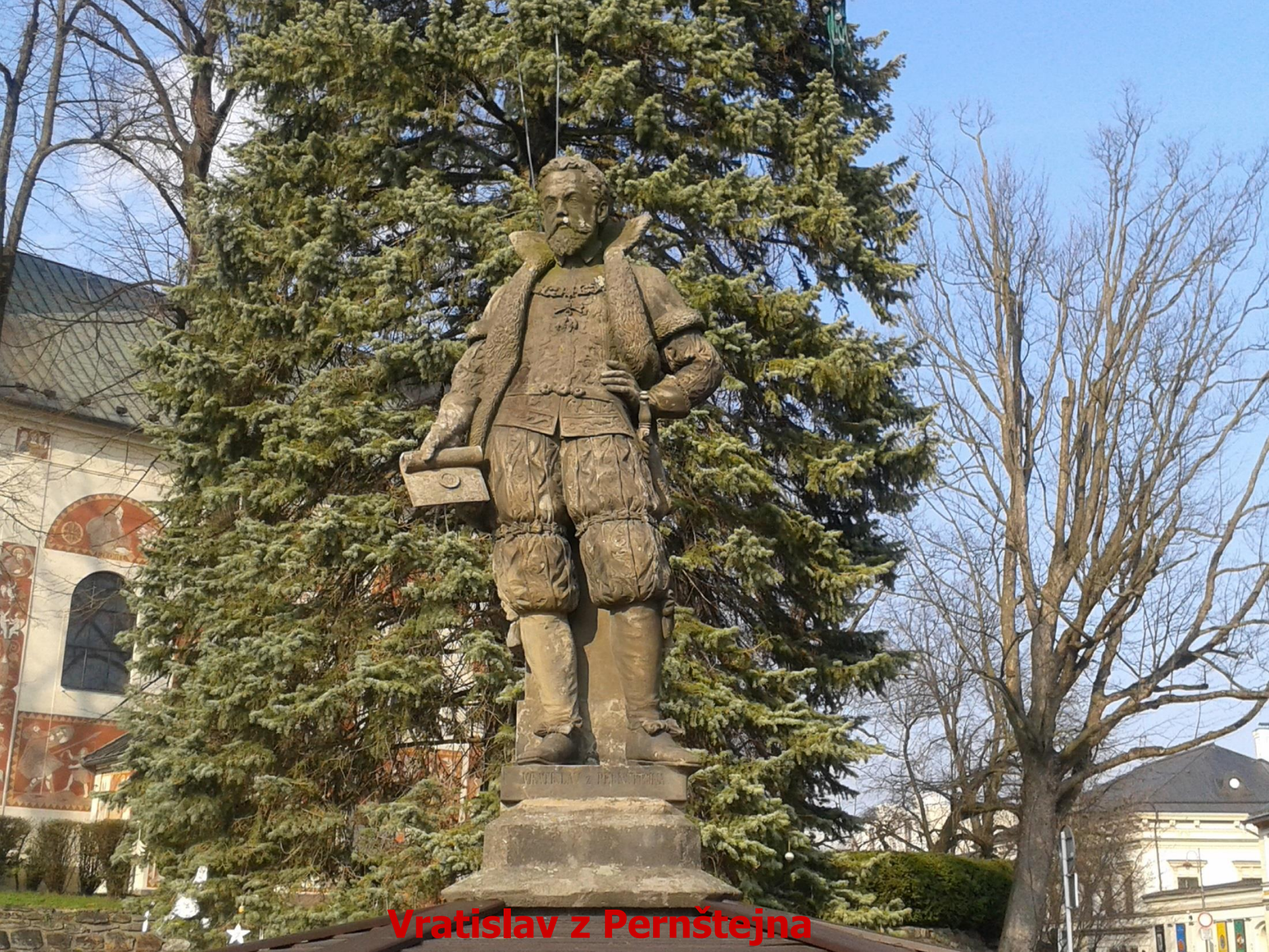
Vratislav z Pernštejna